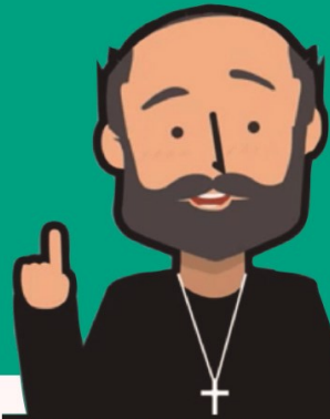
SAN IGNACIO DE LOYOLA

-UN MODO DE ORACIÓN PARA VER CÓMO DIOS ESTÁ EN TU VIDA-