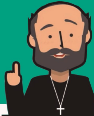
SAN IGNACIO DE LOYOLA

-UN MODO DE ORACIÓN PARA VER CÓMO DIOS ESTÁ EN TU VIDA-