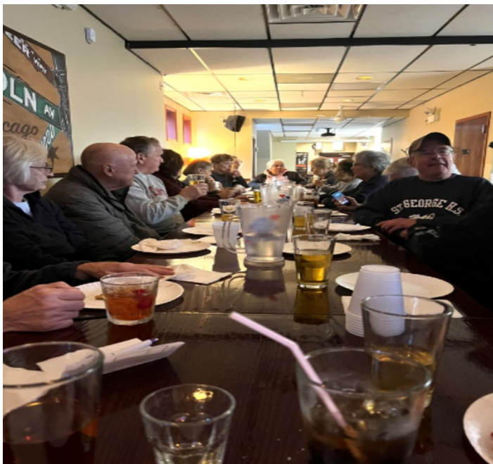
Senior Social Club enjoying Happy Hour at Ricochet's