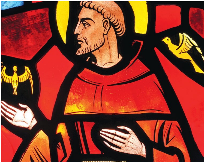
ST. FRANCIS OF ASSISI October 4